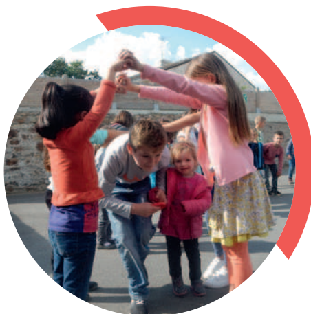
Rencontrer son partenaire oia de l'UGSEL