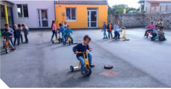
Vivre ensemble sur la cour de récréation