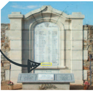
Monument aux morts au cimetière de Vue

Quand on observe attentivement le monument aux morts de Vue, on se rend compte qu'il y a un nom qui semble bien avoir été ajouté et c'est bel et bien le cas.