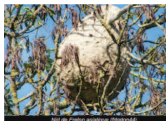
Nid de Frelon asiatique (fdgdon44)

Si vous êtes concernés par la présence de frelons asiatiques, contactez la mairie au 02 40 64 28 34.