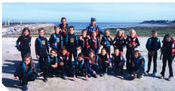
Séance voile à Piriac-sur-Mer