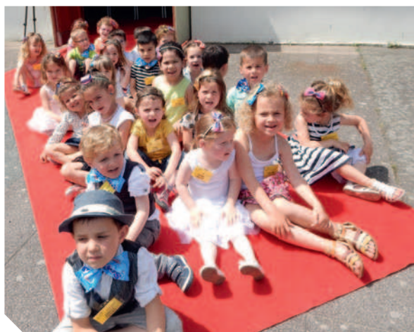
Classe de PS/MS sur le tapis rouge Remise du macaron d'argent.

Après une année gourmande, où la classe de PS/MS s'est illustrée en remportant le macaron d'argent lors du Concours « Expressions numériques » en juin, place au sport.