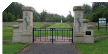
Entrée de la Nécropole nationale de la Forestière à Lachalade