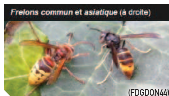
Frelons commun et asiatique (à droite)