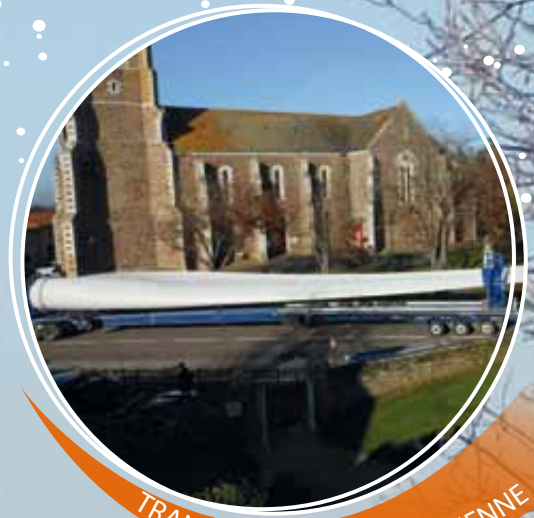
TRANSPORT DE PALE D'ÉOLIENNE