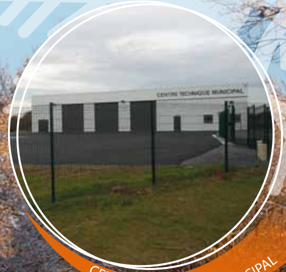
CENTRE TECHNIQUE MUNICIPAL