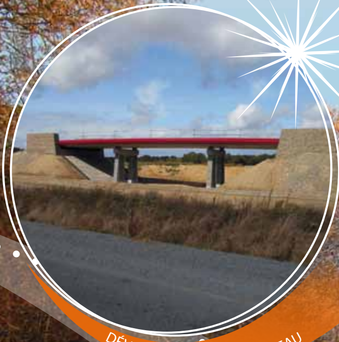
DÉVIATION - LE PETIT PÂTUREAU