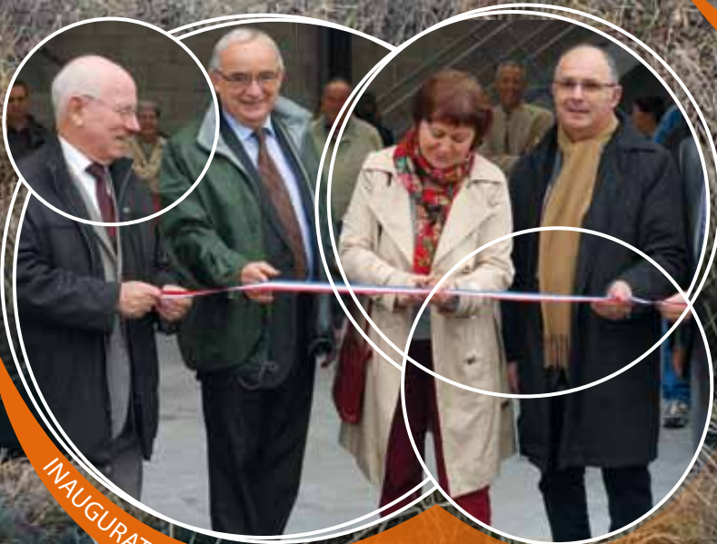
INAUGURATION DU CENTRE TECHNIQUE MUNICIPAL