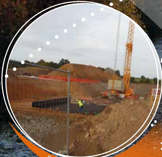
DÉVIATION - LA MAQUINIÈRE