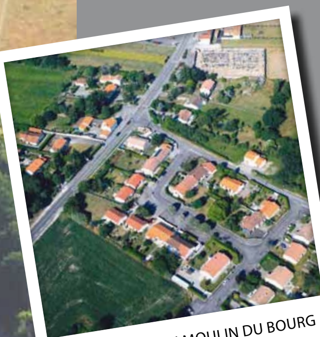
LOTISSEMENT DU MOULIN DU BOURG